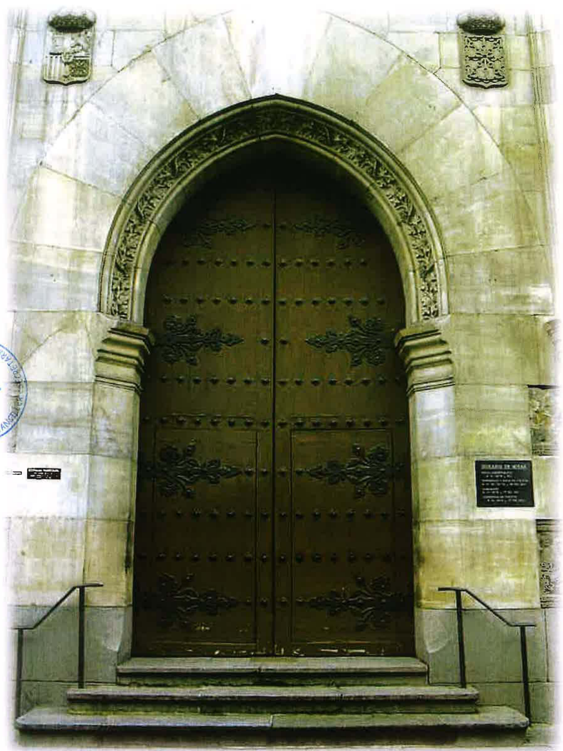
Puerta principal de la Iglesia de San Fermín.